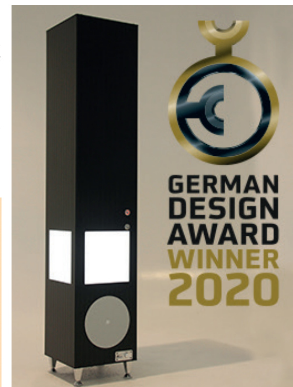
Der Tower 3IN1 wurde ausgezeichnet mit dem German Design Award 2020!

**Farben aus dem Redwell-Farbspektrum gegen Aufpreis