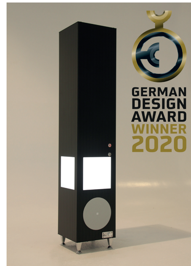
Tower 3IN1, schwarz