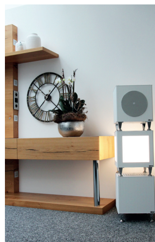
Mit Cube Music und Cube Light kombinierbar.